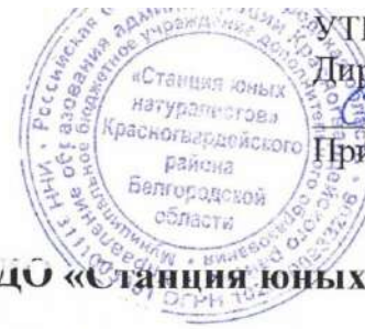
Схема безопасного движения учащихся МБУ ДО «Станция юных натуралистов»

Директор МБУ ДО СЮН Н.Н. Литвинова Приказ №170 от 01.08.2023 г.